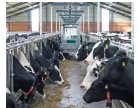
Free Stall Feeder