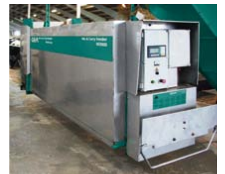
Mix & Carry